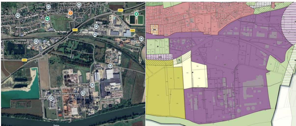
Zone d'activité économique de la commune d'Alizay – vue Google Maps et extrait du plan de zonage n°1 du PLUi-H – commune d'Alizay

La zone d'activité économique d'Alizay, où sont implantées notamment les entreprises Ashland, Biomasse Energie d'Alizay (BEA) et VPK Paper Normandie, est classée en zone UZ dans le PLUi-H de la communauté d'agglomération Seine-Eure (cf. plan ci-dessus).