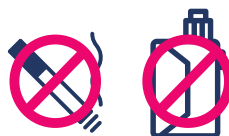
cigarette et cigarette électronique