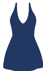
maillot de bain jupe jusqu'à mi-cuisses