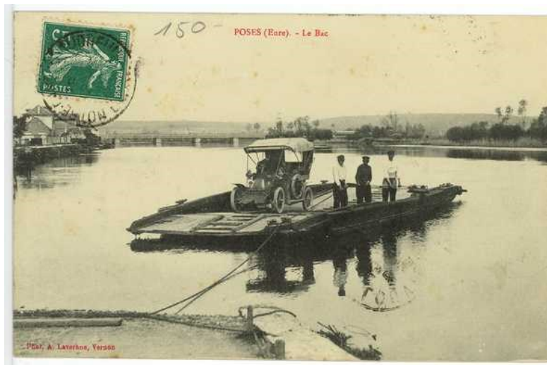
Vue du bac de Poses au début du XXe siècle (AD Eure, 8 FI 474/13)