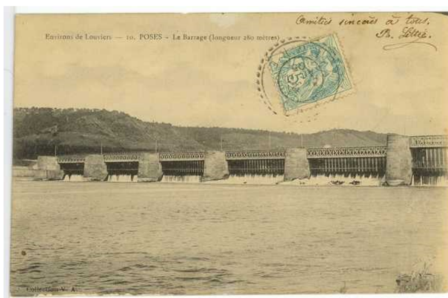
Vue du barrage de Poses au début du XX e siècle (AD Eure, 8 Fi 474/14)