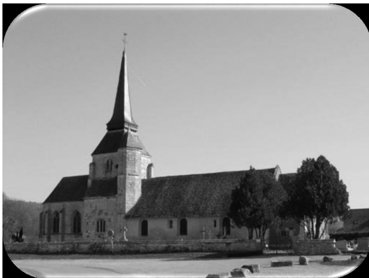
Vue de l'église de Poses au début du XX e siècle (AD Eure, 8 Fi 474/1)

27474_1P1 Biens de la fabrique, mise en location par l'Etat : correspondance (1907-1910) ; remise à la commune : procès-verbal (1913) ; demande d'acquisition d'une pièce de terre au lieudit « la Vigne » : correspondance (1924-1926) ; matériel destiné au service extérieur des inhumations, mise à bail : bail, correspondance (1907). 1907-1926