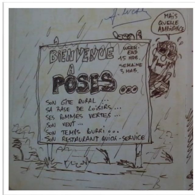
Extrait du livre d'or du gîte communal (AC Poses, 3 R 9 – Phot. V. Gasly, CASE)