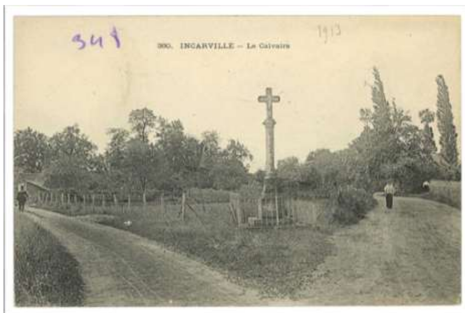
Le calvaire d'Incarville