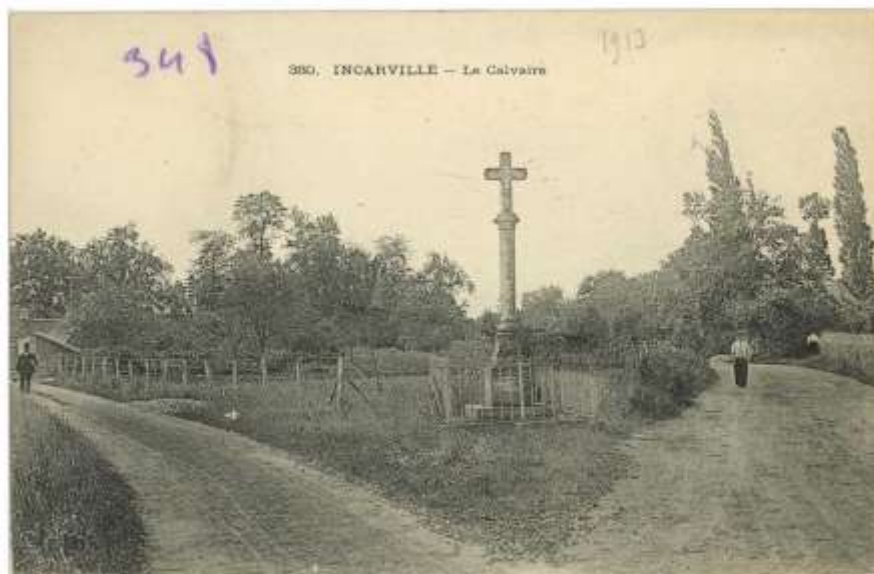
Le calvaire