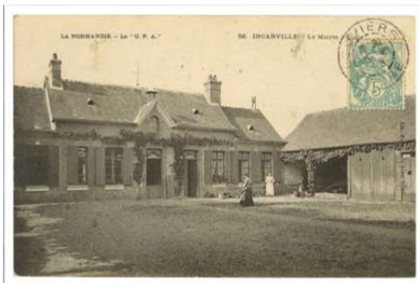
La mairie et l'école, début XXe siècle