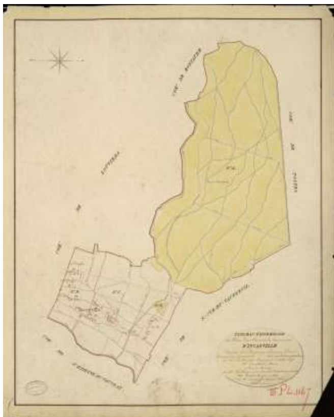
Tableau d'assemblage de la commune d'Incarville, 1823 (ADEure, 3PL1167)

27351_3G3 Postes et télégraphes, amélioration du service postal : correspondance 4 (1880-1898); tarif des télégrammes : correspondance autour de la distance kilométrique qui sépare Louviers d'Incarville (1890).