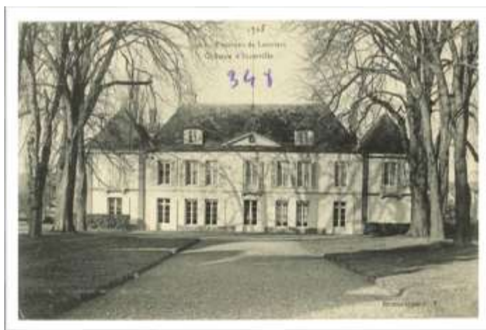
Le château d'Incarville (ADEure, 8 FI 348/9)

27351_2S1 Association Sports et Loisirs d'Incarville (ASLI) : support de présentation, procès-verbal d'assemblée générale de la section judo, comptes rendus de réunion, bilans annuels, liste des membres du bureau, correspondance. 1995-2007 27351_2S2 Club du 3 e âge : état des dépenses et recettes (copie du registre comptable). 2011-2015 27351_2S3 Association Sports et Loisirs d'Incarville (ASLI), comptabilité : décompte. 2016 27351_2S4-5 Comité des fêtes. 2012-2018 27351_2S4 Administration générale : statuts, récépissé de déclaration, registre d'assemblées générales, extrait du Journal officiel. 2012 27351_2S5 Comptabilité : registre. Hors format 2012-2018