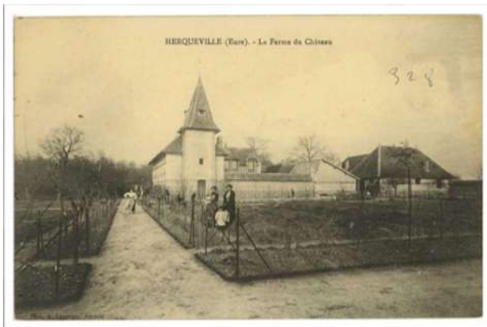
La ferme du château de Louis Renault, début 20 e siècle (AD Eure, 8 FI 328/10)