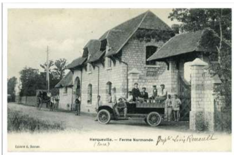
Les employés de Louis Renault devant sa propriété, début 20 e siècle (AD Eure, 10 NUM 4898)