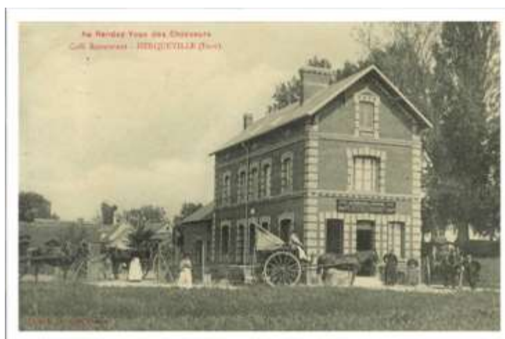
Café restaurant « Au rendez-vous des chasseurs », début 20 e siècle