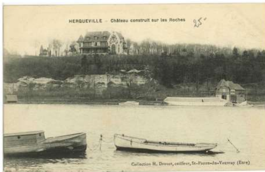
La propriété Renault vue de la Seine, début 20 e siècle