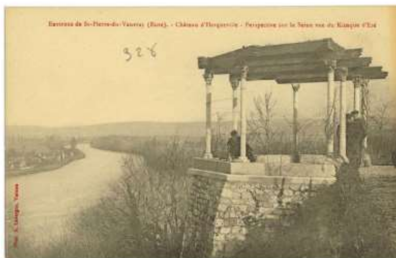
Perspective sur la Seine depuis le château d'Herqueville, début 20 e siècle (AD Eure, 8 Fi 328/13)