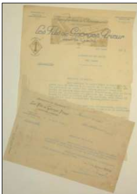
Appel des Établissements « Les fils de Georges Prieur » à protéger l'usine des grévistes, 1932 (Archives des Damps, 7 F 1)

29196_7 F 3 Syndicats ouvriers, déclaration : registre ; syndicat CGT Bendix : statuts, liste des membres du bureau, certificat de déclaration. 1987