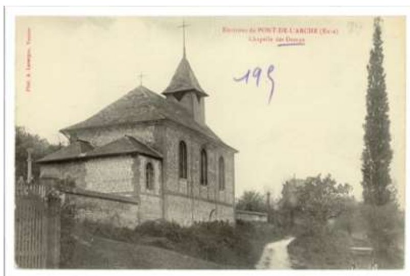
Chapelle des Damps (AD Eure, 8 Fi 195/3)