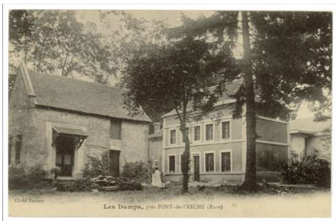
Vue des Damps au début du XXe siècle (AD Eure, 8 Fi 195)