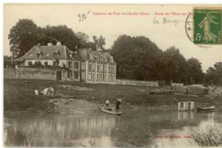
Bords de l'Eure au début du XX e siècle (AD Eure, 8 FI 195/7)