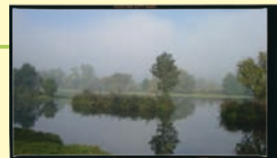
L'Eure aux Damps

Les communes de Louviers (19 000 habitants) et de Val-de-Reuil (14 000) sont les communes principales de cette agglomération. Crasville, avec 124 habitants, est la moins peuplée.