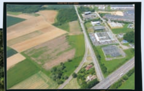
Zone d'activité Écoparc à Heudebouville