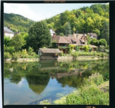
L'Eure à Acquigny