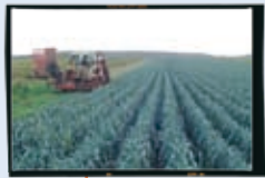
Maraîchers à Criquebeuf-sur-Seine