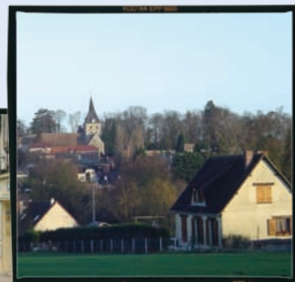
Logements à Montaura