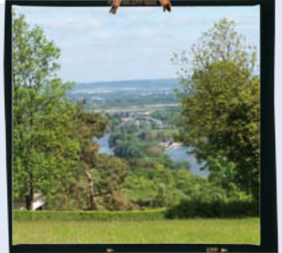
Panorama sur la Seine à Vironvay