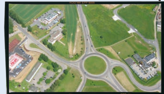
Rond-point des Saules à Val-de-Reuil