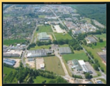
Parc d'activité de la Fringale - Louviers/Incarville