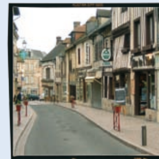
Centre-ville de Pont-de-l'Arche