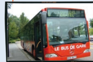
Bus de gare à Val-de-Reuil